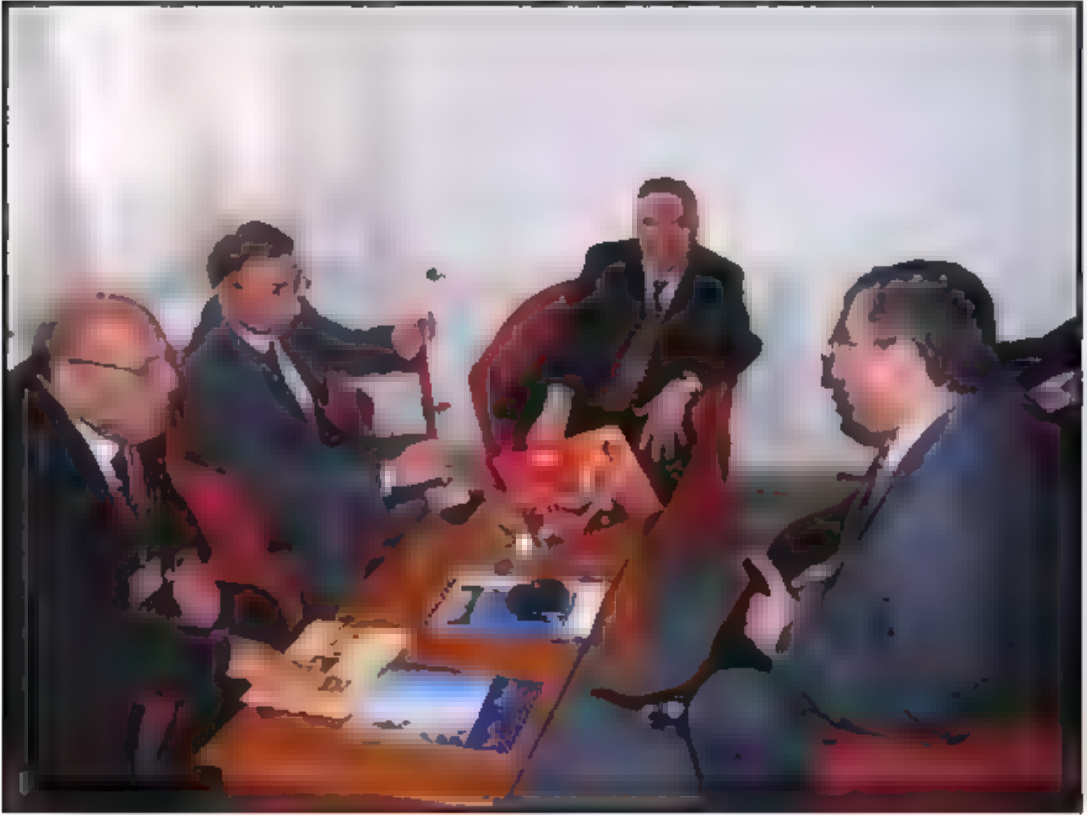
Aralarda Katılımcılarımız Dinlenirken Bir Yandan da Fikir Akışverişinde Bulundular